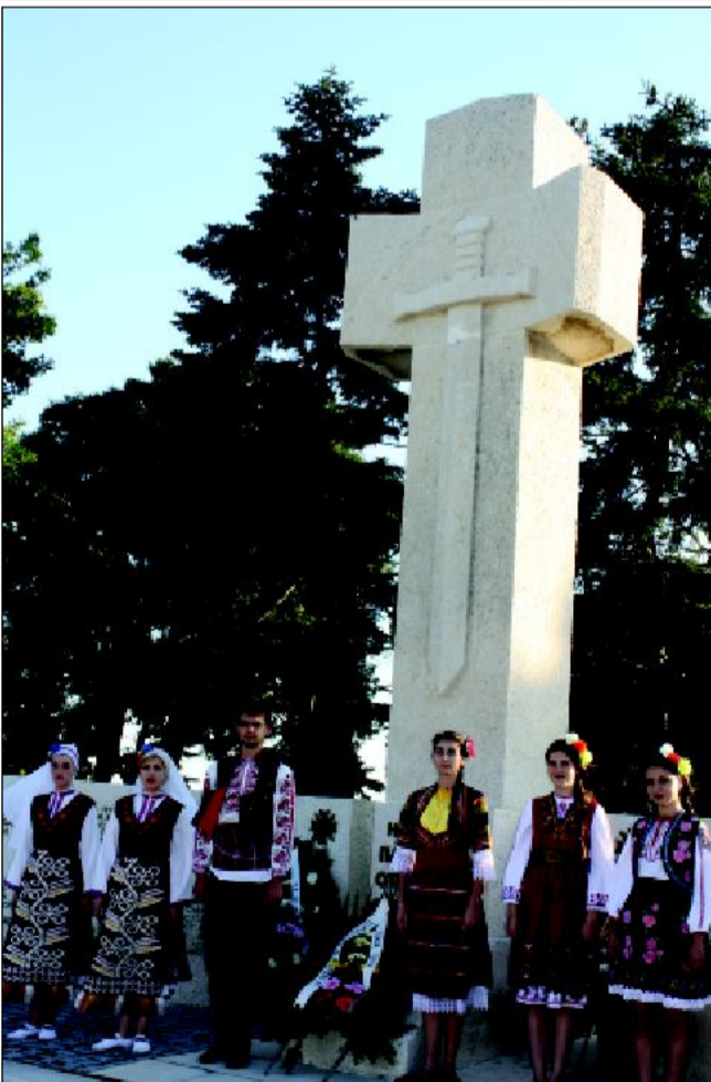
Венци за почит към падналите във войните от Община Балчик